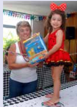
Cora (Joaninha) – Galinha Pintadinha