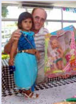
Bianca (Odalisca Azul) – Boneca Jardim