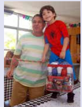
Renan (Homem Aranha) – Brinquedo Boliche