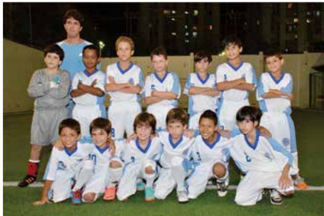
Equipe da AABB-Rio

Os atletas da equipe de Futsal da AABB-Rio participarão do Torneio Internacional de Futebol Infantil “Mundialito” na modalidade de Futebol-7, em Portugal e Espanha, respectivamente nas localidades de Vila Real Santo António em Algarve-Portugal e Ayamonte na Andaluzia-Espanha de 23 a 31 de Março.