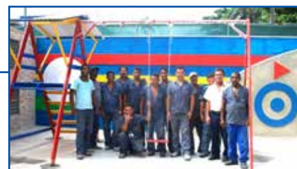
Funcionários da AABB, da equipe de manutenção

“Ao iniciarmos a obra, surgiu uma dúvida com relação à segurança do prédio edificado onde funciona a biblioteca, pelo fato de que algumas rachaduras apareceram no piso. Fizemos a análise e verificamos que o piso sofre essa queda em virtude da acomodação do terreno em