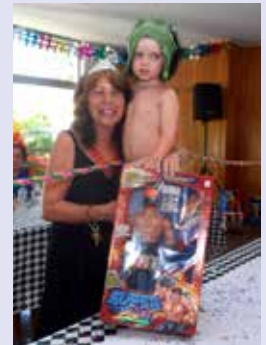
Pedro (Hulk) - Boneco