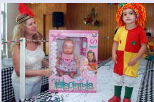
Alice (Emília) – Boneca Tagarela;