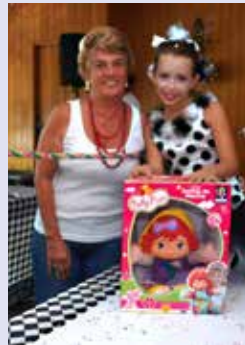
Camila (Colombina) – Boneca Frutinha