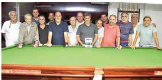
Confraternização da Turma da Sinuca (1)