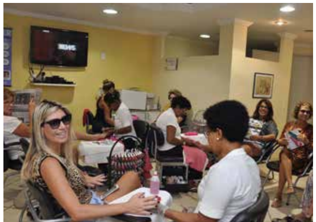
Cuidando da beleza das associadas

Qualquer informação peça diretamente à recepção do Salão ou pelos telefones fixos 2540-5190 ou 2274-4722 ramal 421.