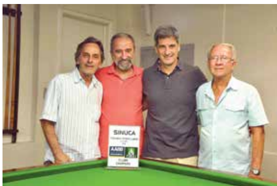
Vice-Presidente Esportivo - Diretor e Coordenadores da Sinuca