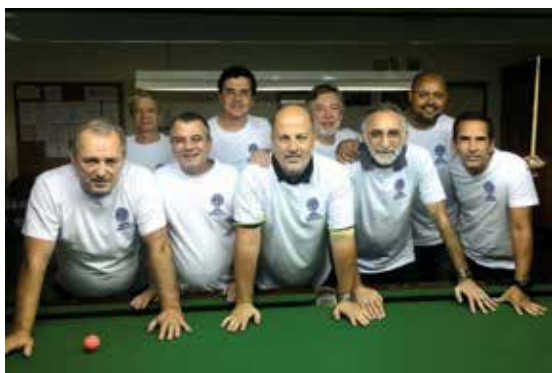
Equipe AABB Lagoa