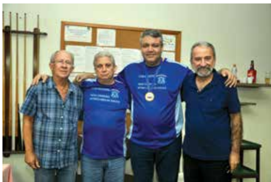
A Direção da AABB-Rio e da Federação que organizaram o Torneio

A AABB-Rio, nas pessoas de seu Vice-Presidente Esportivo, de seu Diretor de Sinuca e de seus Coordenadores, juntamente com a direção da FSBERJ presente ao evento, agradecem a participação de todos os jogadores na competição e parabenizam os clubes pelo sucesso do torneio.