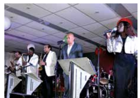
A excelente orquestra Commander, com um repertório na medida exigida pelos dançarinos