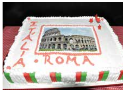
O bolo confeitado e distribuído aos aniversariantes e convidados