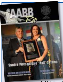
Sandra Tavares Pires, essa elegante senhora que aparece na foto recebendo as honras dos dirigentes do voleibol internacional, é associada da AABB-Rio. Trilhou brilhante carreira de atleta do voleibol nacional, vestindo a camisa do Brasil e sob o patrocínio do Banco do Brasil conquistou importantes títulos de projeção internacional. Destacamos as medalhas de ouro olímpicas de Atlanta (EUA), na estreia do voleibol de praia nos Jogos, e de Pequim (China). Ela ganhou ainda o bronze em Sidney (Austrália) ocasião em que teve a honra de ser a primeira mulher a conduzir a bandeira brasileira na abertura dos Jogos Olímpicos. Enriquecem suas conquistas a eletrizante marca de 1000 vitórias em sua carreira só agora materializada com a eternização de seu nome no Hall da Fama do Voleibol Mundial, onde já figuram nomes de celebridades como Jackie, com quem formou uma dupla de emocionantes triunfos no vôlei de praia. Foto do cerimonial realizado em outubro na cidade americana de Holyoke.