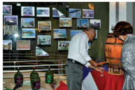
Um barril de madeira inteirinho com vinho suave