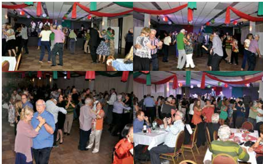
O salão repleto com os dançarinos esbanjando alegria

a execução da valsa para os casais rodarem o salão. Uma noite primorosa que se espera seja repetida em outras mais.