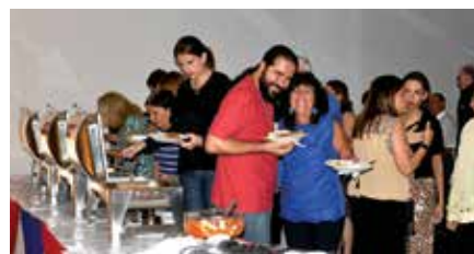
Buffet de massas variadas e especialmente nhoque