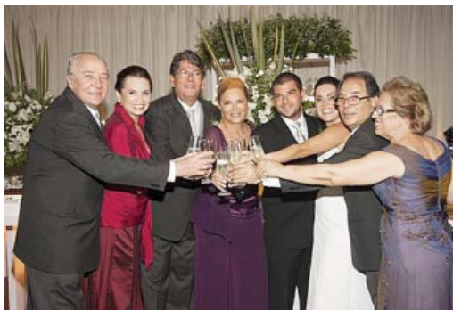
Os pais fazem o brinde aos nubentes