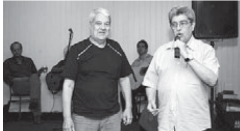
Nosso conselheiro Comaru enaltecendo a noite seresteira