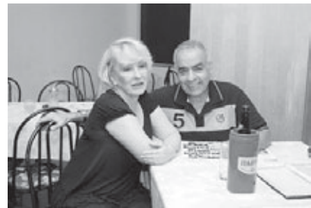
Vice-Presidente Administrativo do Tijuca Tênis Clube e esposa

A próxima Noite dos Seresteiros será no dia 8 de abril, das 19h às 23h. Não percam!