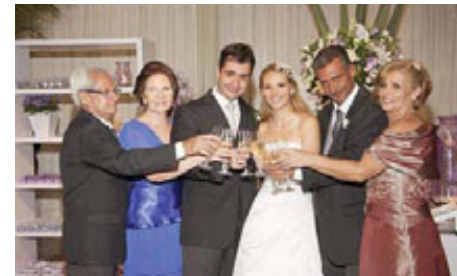
O tradicional brinde dos pais com o novel casal