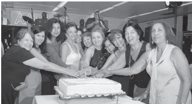
As meninas sorridentes cortam o bolo simbólico

Os aniversariantes de abril terão sua festa no dia 15/04, com a orquestra “Commander”. É para não perder!