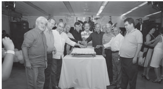
O conjunto dos homens cortam o bolo simbólico