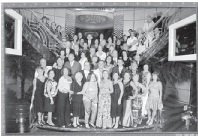
Associados da AABB realizam sonho

(*) Associada da AABB-Rio e colaboradora da Revista.