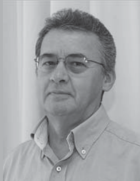
REVISTA AABBRIO ANO XVI – Nº 199 Abril de 2011

Ao relembrar alguns fatos que fazem parte da história de nossa AABBRIO, um deles merece registro porque era no mínimo engraçado e ao mesmo tempo esquisito que é aquela estória falada por alguns colegas, funcionários do Banco, que diziam não se associar ao Clube porque já viviam a semana toda convivendo e trabalhando com funcionário do Banco do Brasil e nos fins de semana queriam aproveitar para desfrutar de outros convívios.